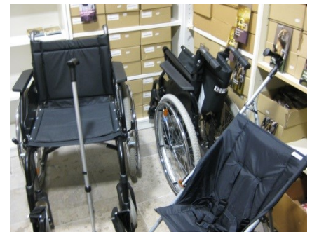
Abb. 6: Hilfsmittel zum Ausleihen