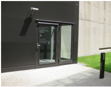
Abb. 1: Nebeneingang mit Aufzug