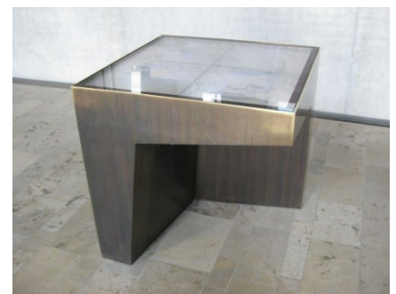
Abb. 9: Unterfahrbare Medien-Station