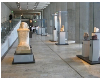
Abb. 7: Leitsystem vom Rundgang