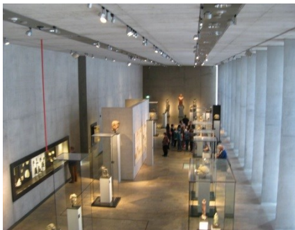
Abb. 4: Blick über die Ausstellung