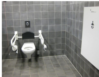
Abb. 5: Öffentliches WC für Menschen mit Behinderung