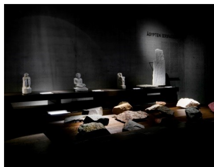
Abb. 8: Raum „Ägypten (er)fassen“