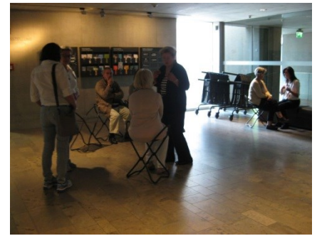
Abb. 3: Leihstühle für Führungen